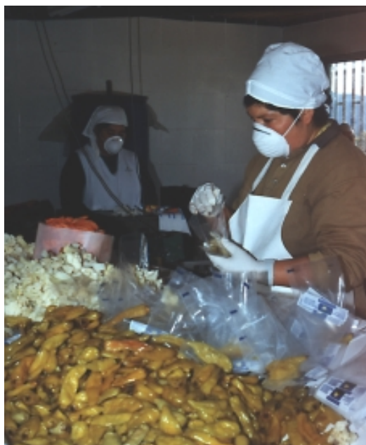
VILLA PRAT, AGROINDUSTRIA DE ENCURTIDOS

En un marco de creciente apertura e integración económica, ningún territorio está exento de las influencias múltiples que ejercerán sobre él tendencias provenientes del ámbito internacional, nacional e incluso regional, sean estas de políticas, económicas,