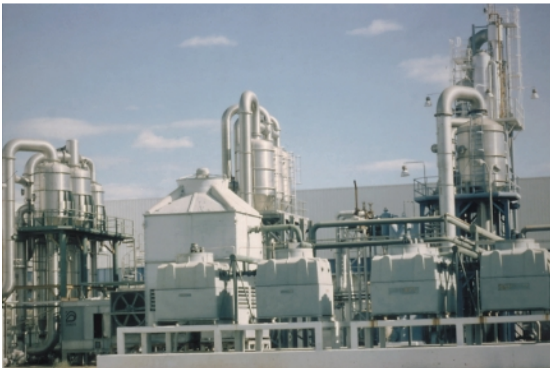
PLANTA IANSAGRO, TALCA

En este plano, en el siguiente cuadro se identifican las principales fortalezas regionales, vinculadas al ámbito de la infraestructura y ordenamiento territorial, desarrollo productivo y medio ambiente, desarrollo social/cultural y recurso humano, clasificación que se adopta sólo con fines analíticos, ya que en la realidad muchas de ellas están fuertemente interrelacionadas y tienen incidencia en más de un aspecto del desarrollo regional.