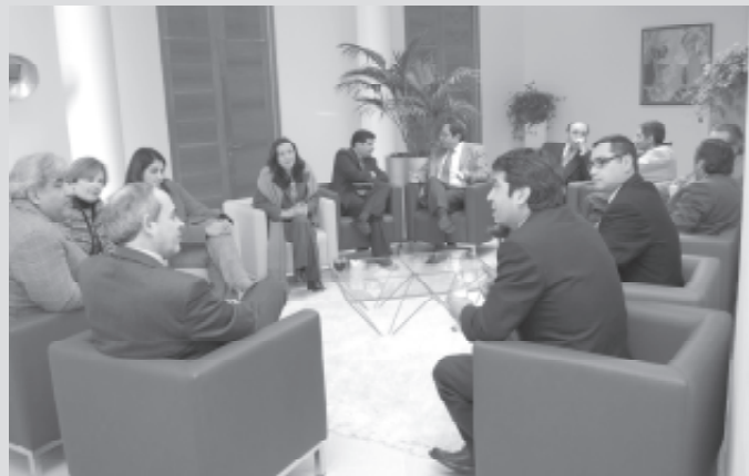
Aspecto de la reunión entre autoridades universitarias y de ex alumnos que hoy ocupan cargos en el Gobierno.