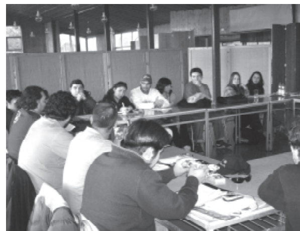
Última reunión de CUNEC que incorporó como nuevo miembro a la Universidad de Talca.

Este año en dicho mes, les corresponde realizar un encuentro deportivo que organizará la Uni-