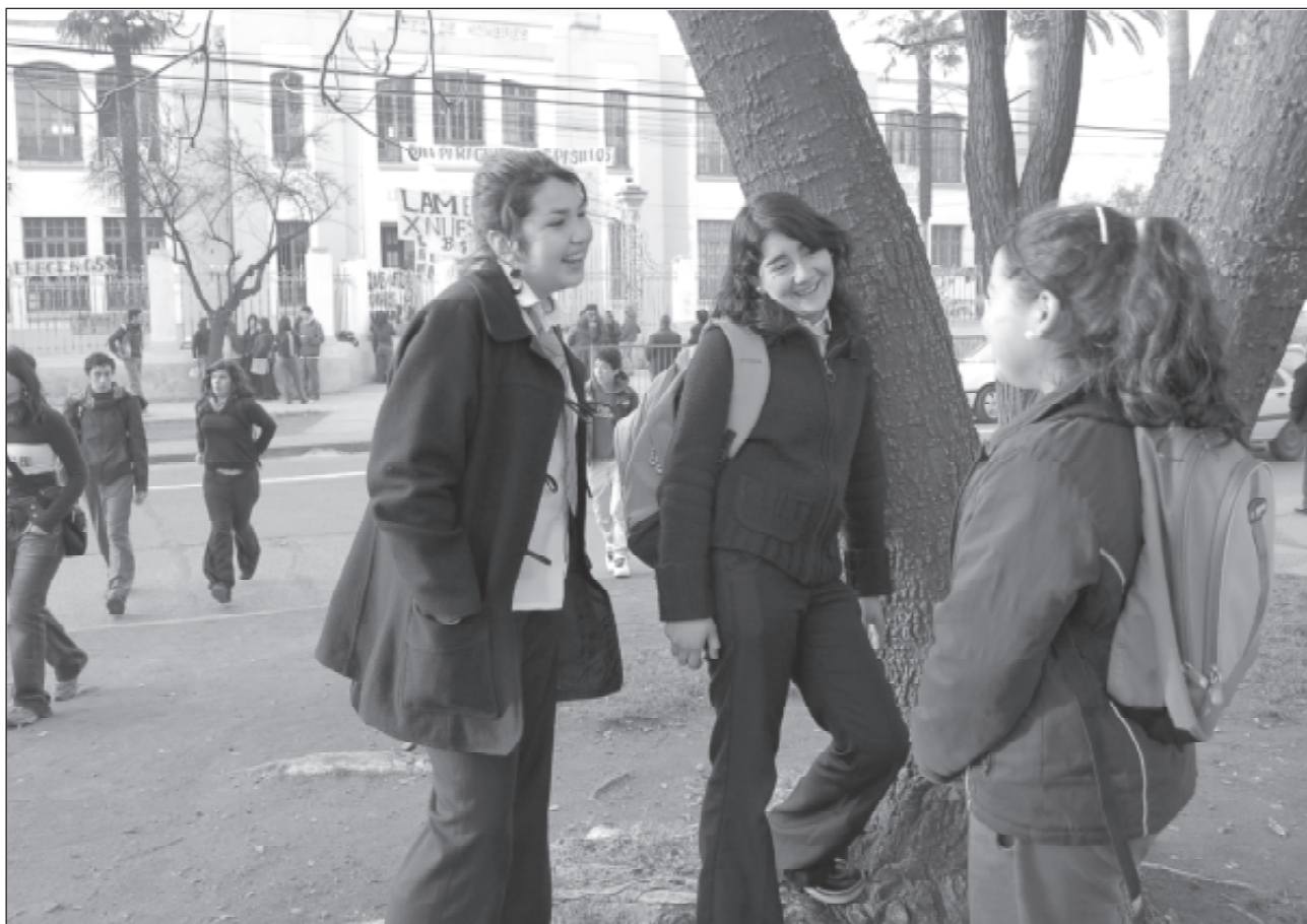
Existe consenso entre académicos e investigadores de la Universidad de Talca que el problema que ha motivado la protesta de los alumnos es la calidad de la Educación pública en nuestro país.